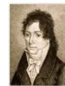
Associazione PIETRO GENERALI

facebook.com/coro.pietrogeneralihotmail.com