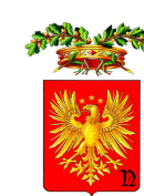
Provincia di NOVARA